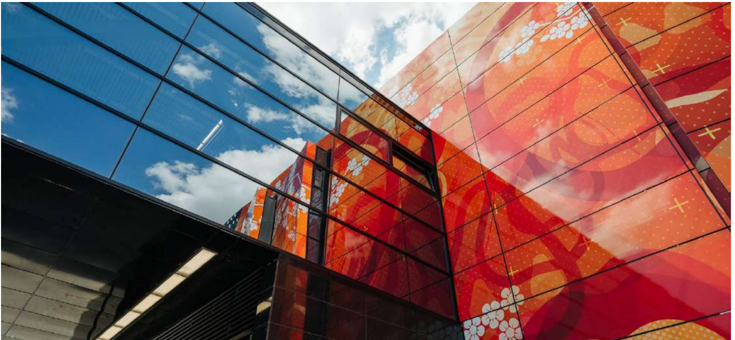
(Michurinsky Prospekt Metropolitana, Mosca)