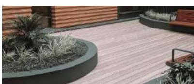
Arredo e Design