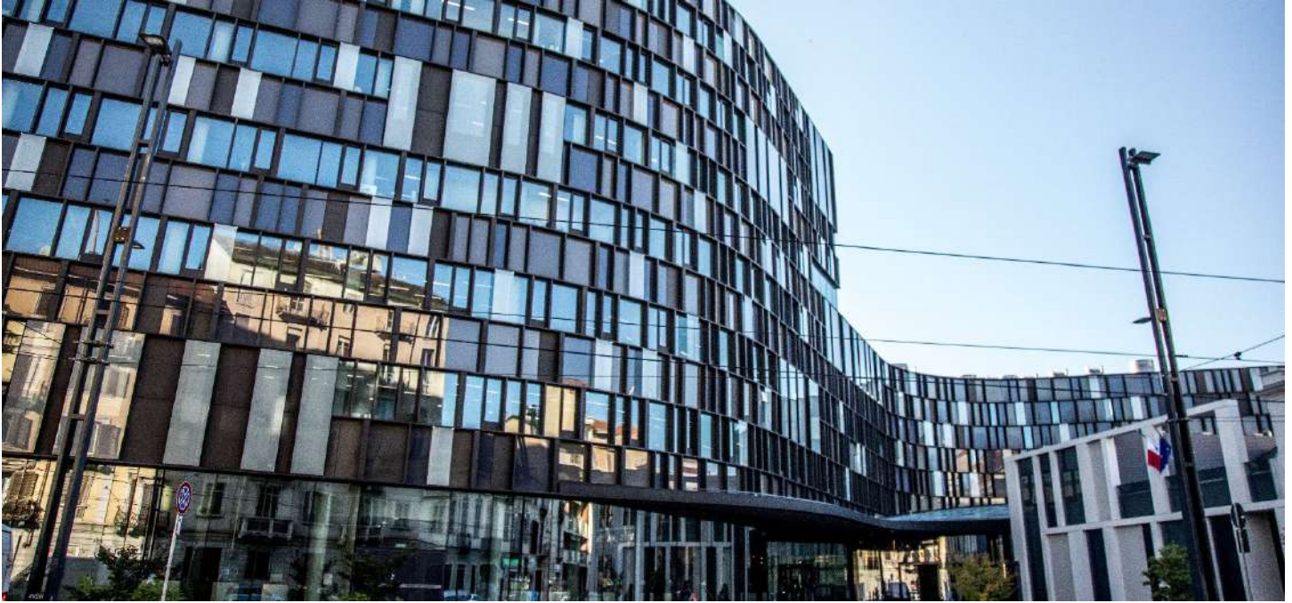
(Nuvola Lavazza, Torino)